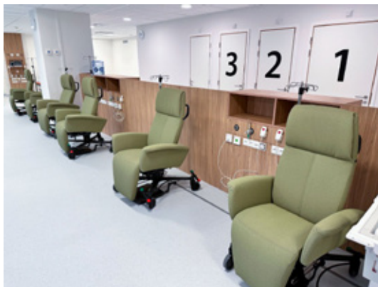
Patiëntenzaal hyperambulant dagziekenhuis

De verpleegkundige komt je halen in de wachtzaal en brengt je naar de patiëntenzaal. Het is niet nodig om je om te kleden. Je kan je jas en waardevolle spullen opbergen in een afgesloten kastje.