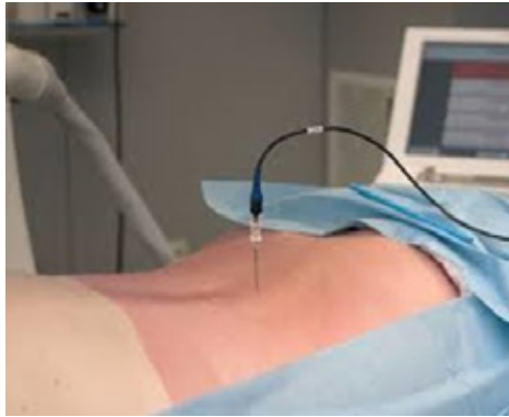
Illustratie van een PROEF infiltratie/PRF van de lumbale wortel

Je familie of begeleider kan tijdens de behandeling in de wachtzaal wachten. De plaatselijke verdoving werkt na enkele uren uit. Daarna kan je je pijnmedicatie verder innemen zoals voorzien.